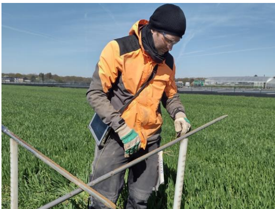
Beurteilung der Bodeneigenschaften durch den Geologischen Dienst

Demnach sind die Beschäftigten und Beauftragten des Geologischen Dienstes NRW berechtigt, Grundstücke – nicht die Gebäude – zu betreten und die notwendigen Arbeiten vorzunehmen. Auf forstliche und landwirtschaftliche Belange und die Nutzung der Grundstücke wird soweit wie möglich Rücksicht genommen. Falls trotzdem durch die Arbeiten Schäden entstehen, werden diese nach den allgemeinen gesetzlichen Bestimmungen ersetzt.