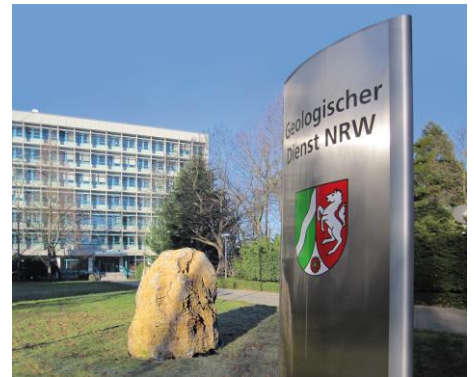
Geologischer Dienst NRW in Krefeld

Im Rahmen der Bodenuntersuchungen führen die Mitarbeiter*innen des Geologischen Dienstes NRW Sondierungen (Handbohrungen) bis maximal 2 m Tiefe durch. Stellenweise werden auch Aufgrabungen angelegt, aus denen Bodenproben entnommen werden.