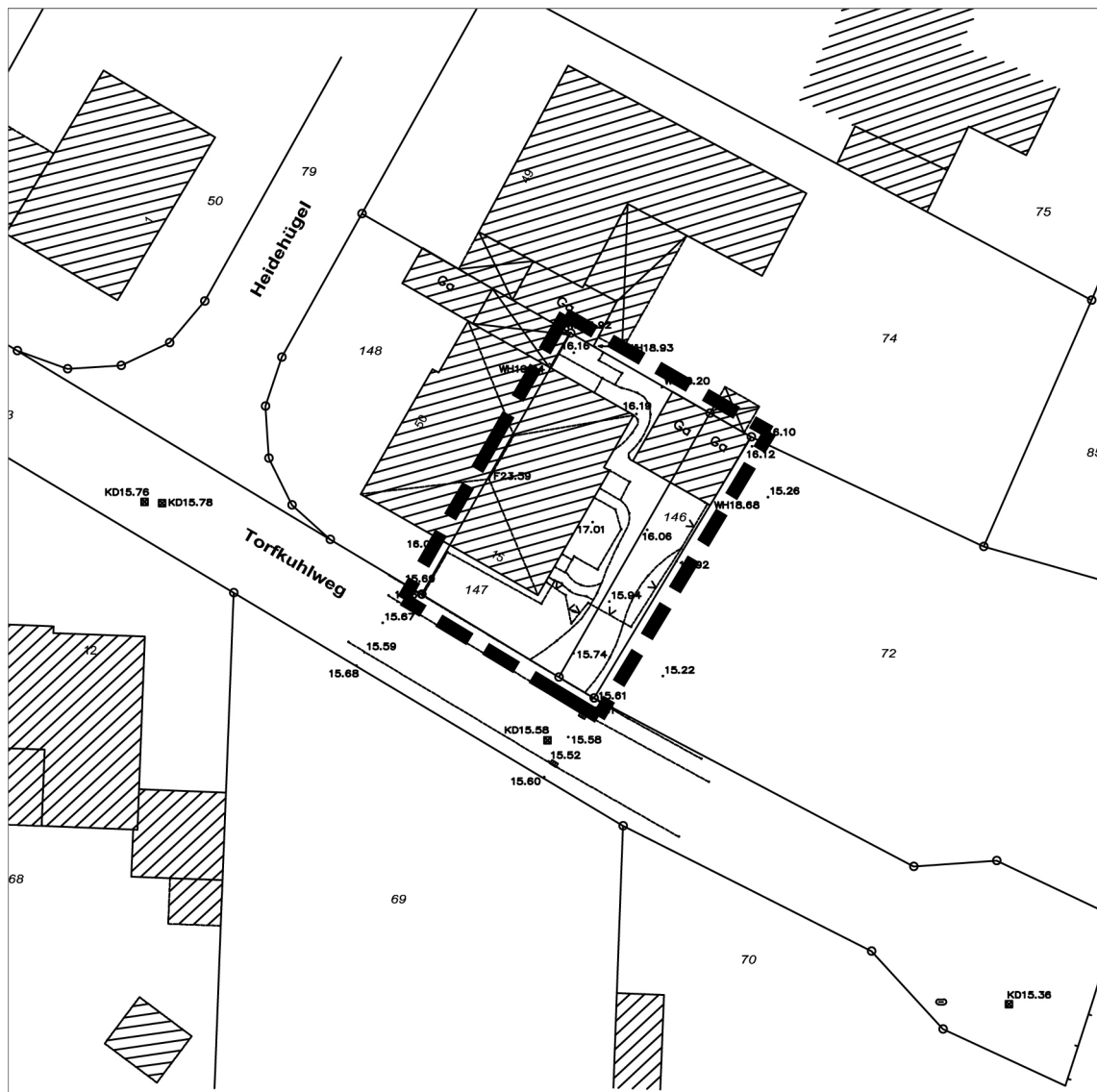
Abbildung 1: Lage des Plangebiets

Der Bebauungsplan setzt die Grenzen seines räumlichen Geltungsbereichs entsprechend der Planzeichnung eindeutig fest.