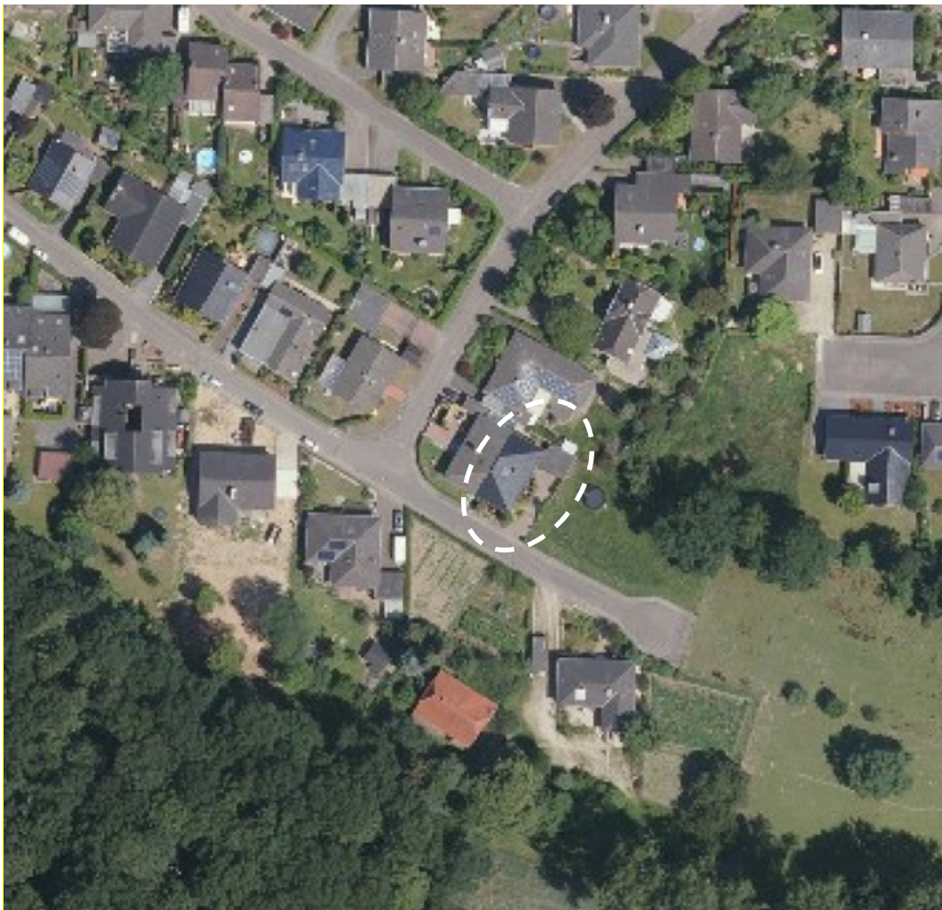
Abbildung 2: Luftbild (Kartengrundlage: TIM online, ohne Maßstab)

Südlich des nahen Ortsrandes beginnt ein rund 180 m breiter, teilweise bewaldeter Grünzug, der die Ortsteile Hasselt und Schneppenbaum voneinander trennt. Die Bundesstraße 57 verläuft in rund 350 m Luftlinie Entfernung nordöstlich des Plangebiets.